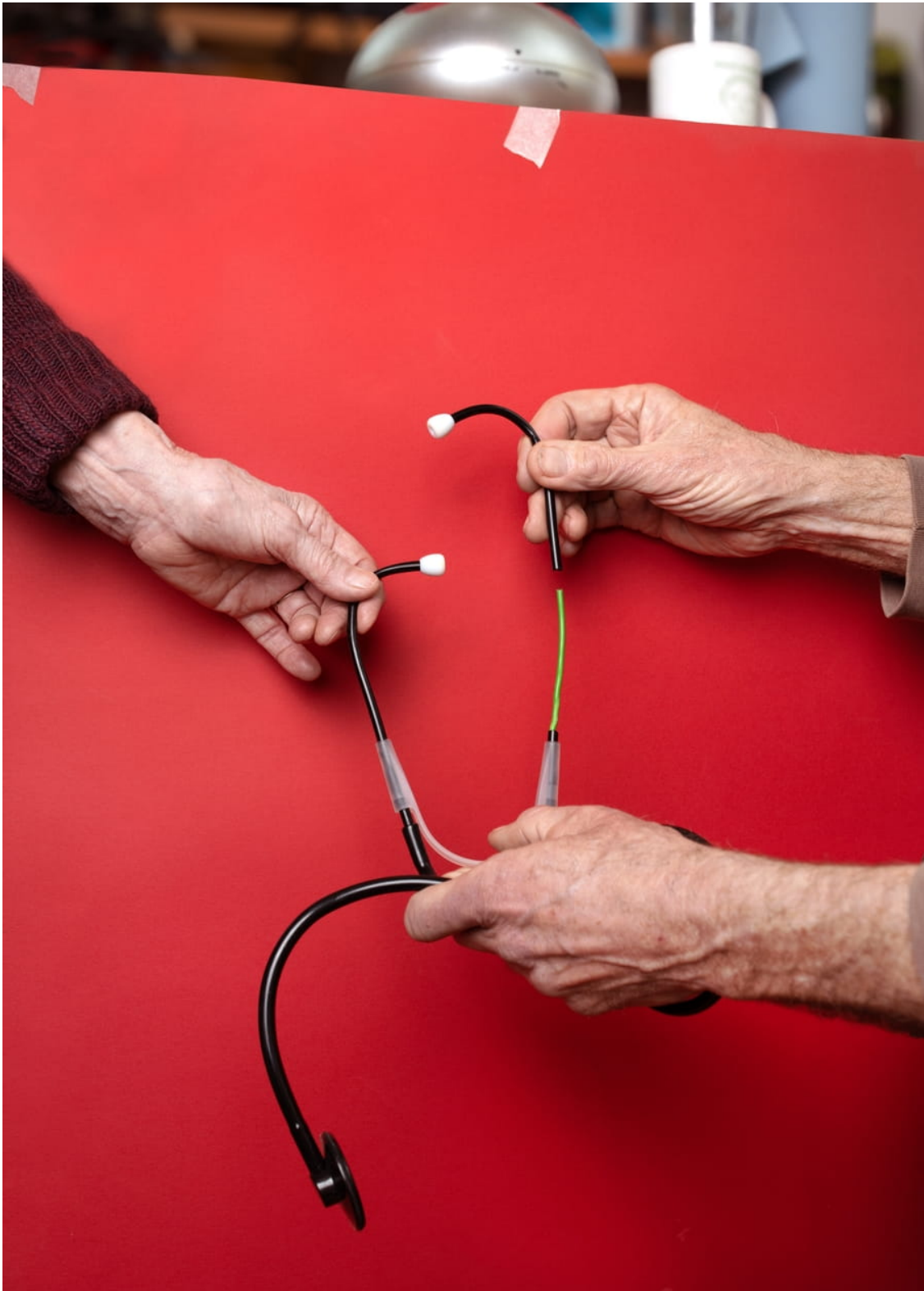
Deze kinderstethoscoop is van plastic. Hij wordt hier op inventieve wijze gemaakt door er een buigbare elektriciteitsdraad in te doen; de stethoscoop is hol en op de foto is te zien hoe hij eroverheen wordt geschoven.