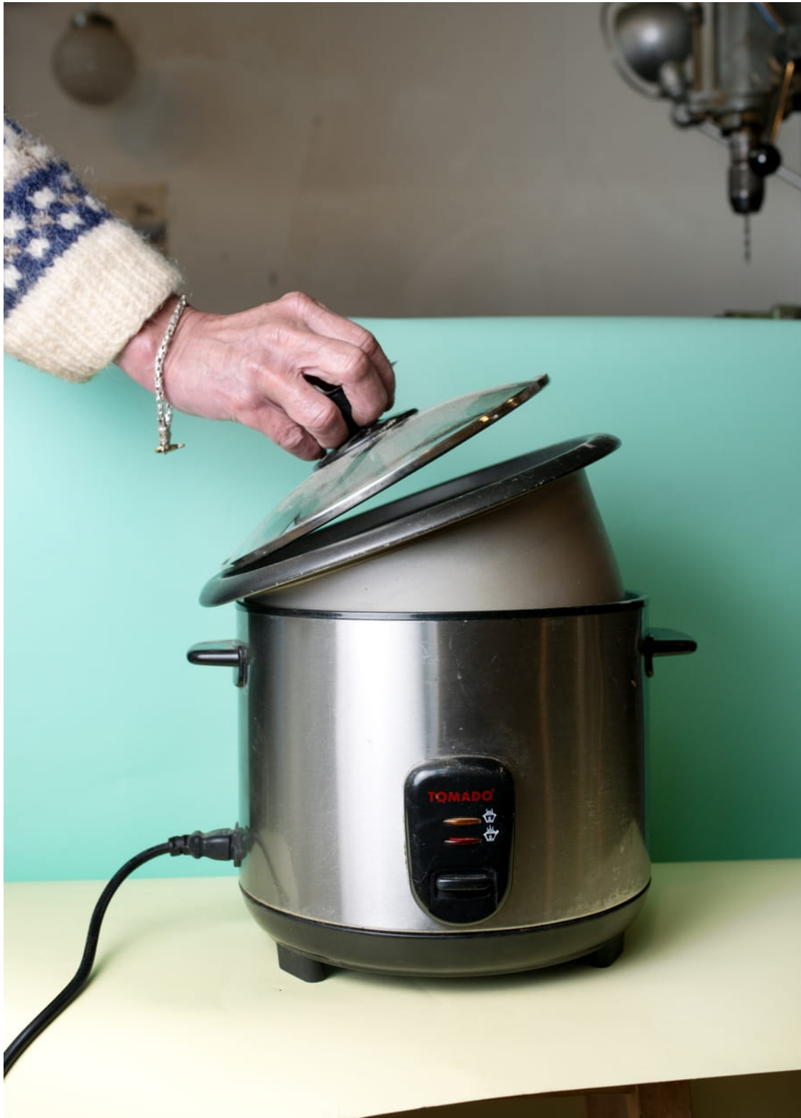
Deze rijstkoker doet het weer. Nu staat hij op de weggeeftafel te wachten op een nieuwe eigenaar.