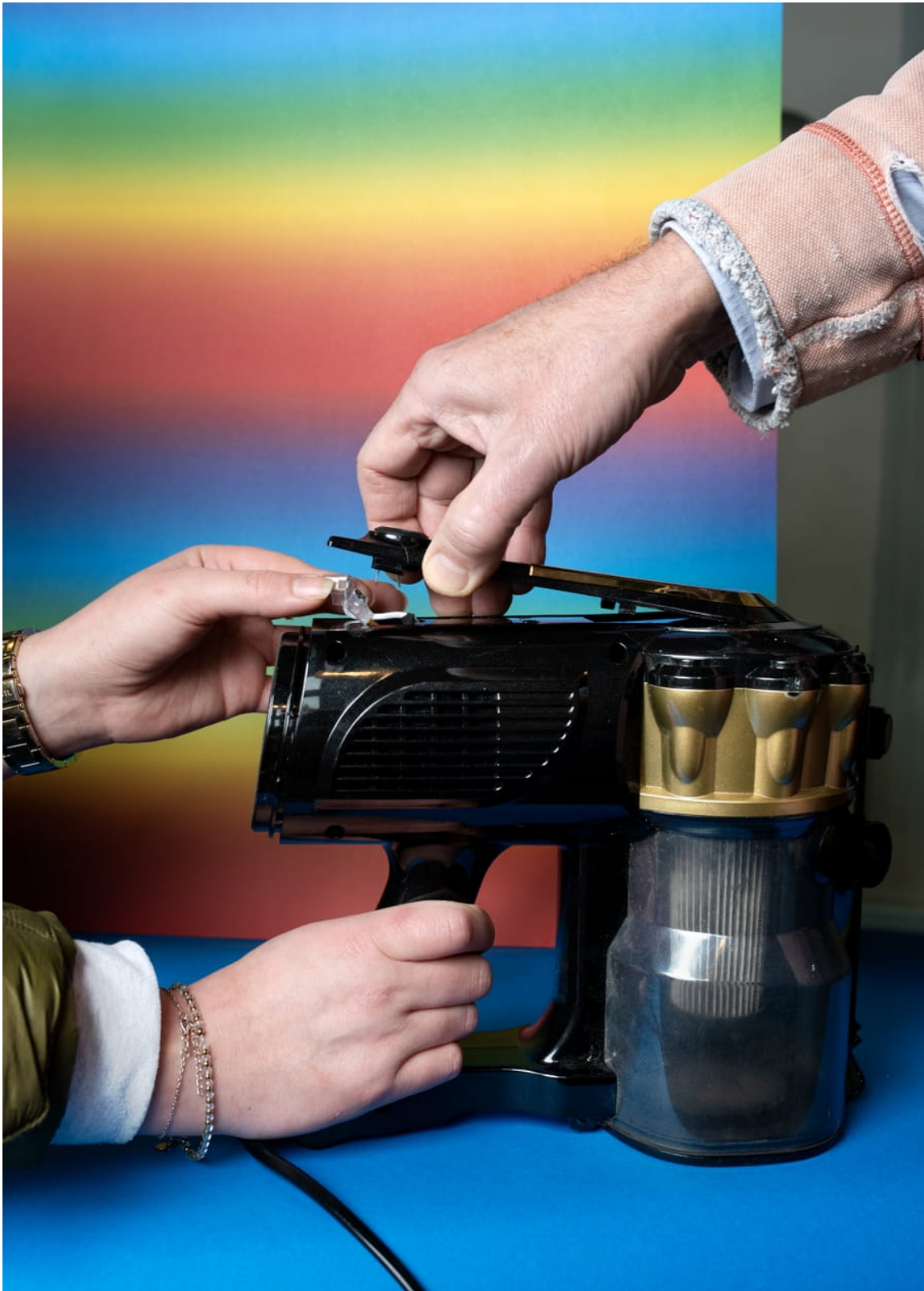
Deze kapotte stofzuiger werd gefikst! Binnenin moest met een draadje een nieuwe verbinding worden gelegd.