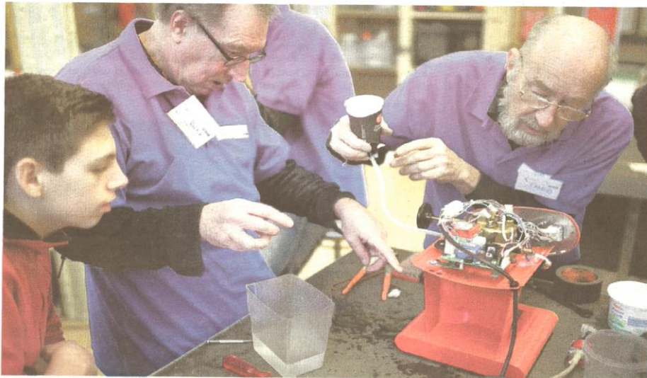
▲ Vrijwilligers van Repair Café Delft worstelen met een weerbarstig koffiezetapparaat. FOTOS MATTHIJS TERMEER

Gratis kapotte spullen repareren of kleding herstellen , het is al vijf jaar een gouden formule voor Repair Café Delft. Elke maand komen tientallen vrijwilligers in actie tegen verspilling en verkwisting. „Hé, weer die Senseo, weer die condensator.”